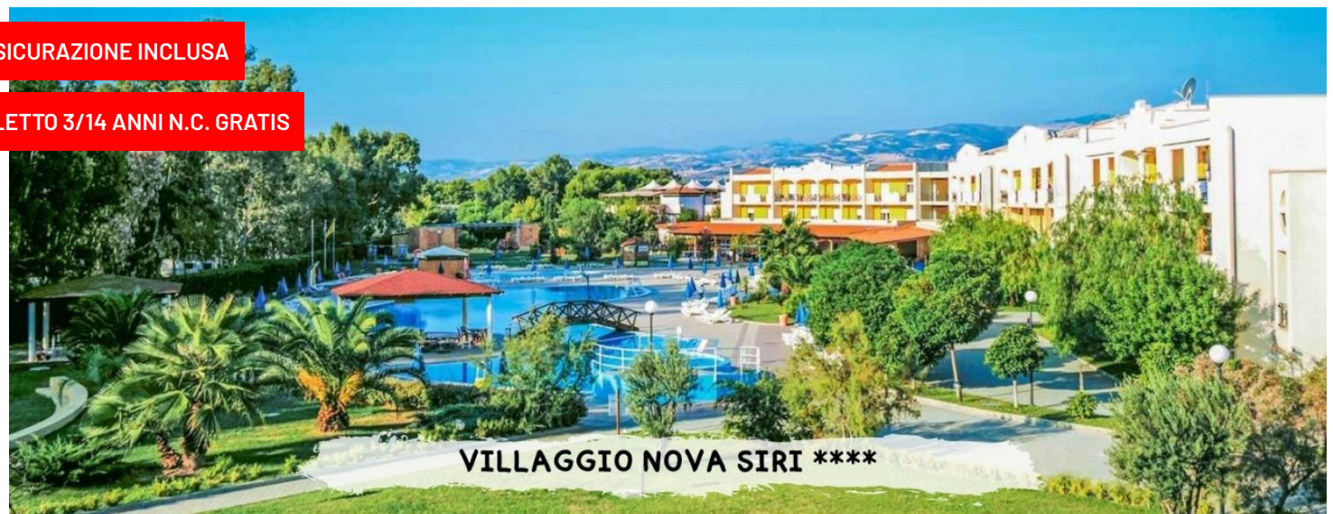
VILLAGGIO NOVA SIRI ****

quote a persona in pensione completa con soft all inclusive