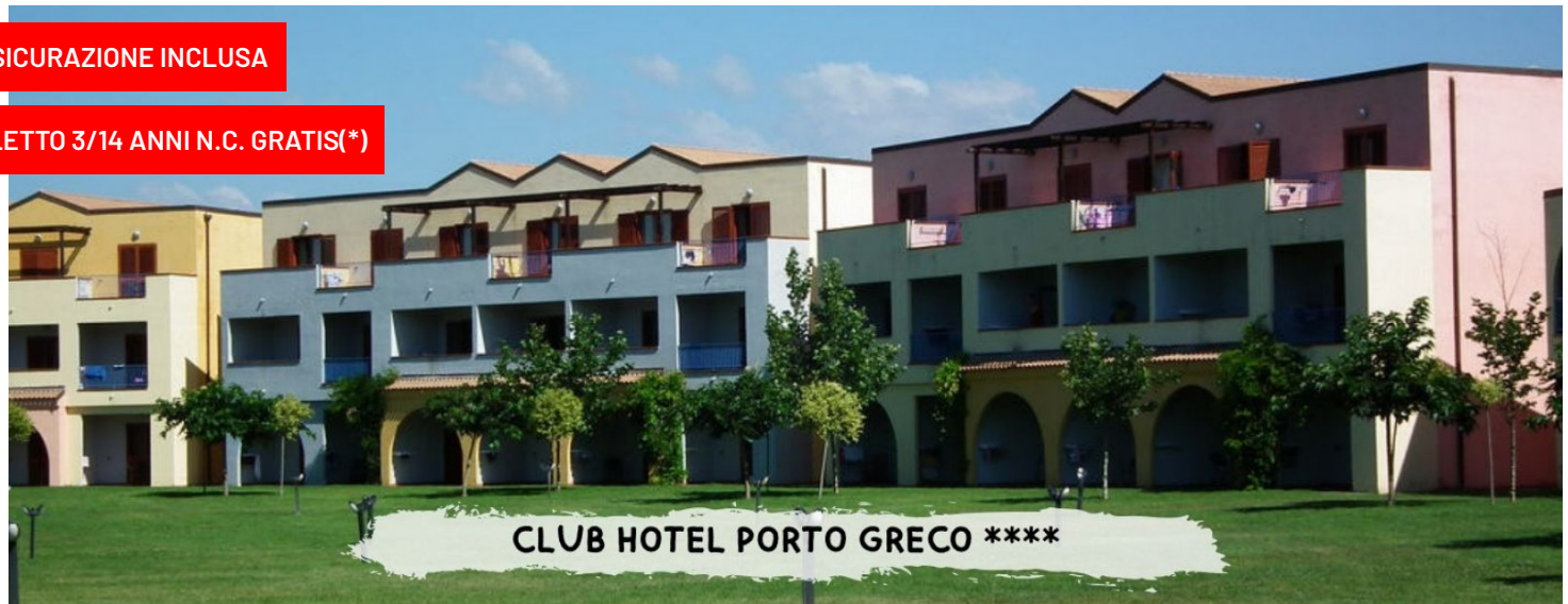
CLUB HOTEL PORTO GRECO ****