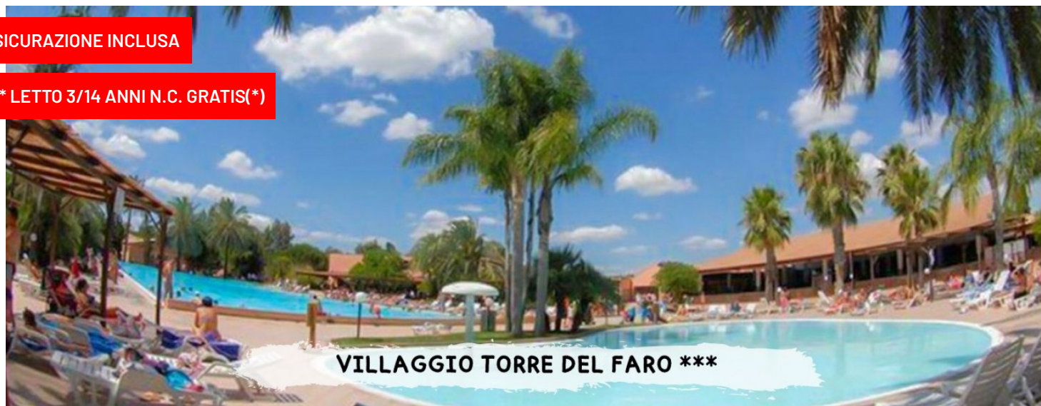
VILLAGGIO TORRE DEL FARO ***

quote a persona in pensione completa - bevande incluse in formula "mondotondo club"