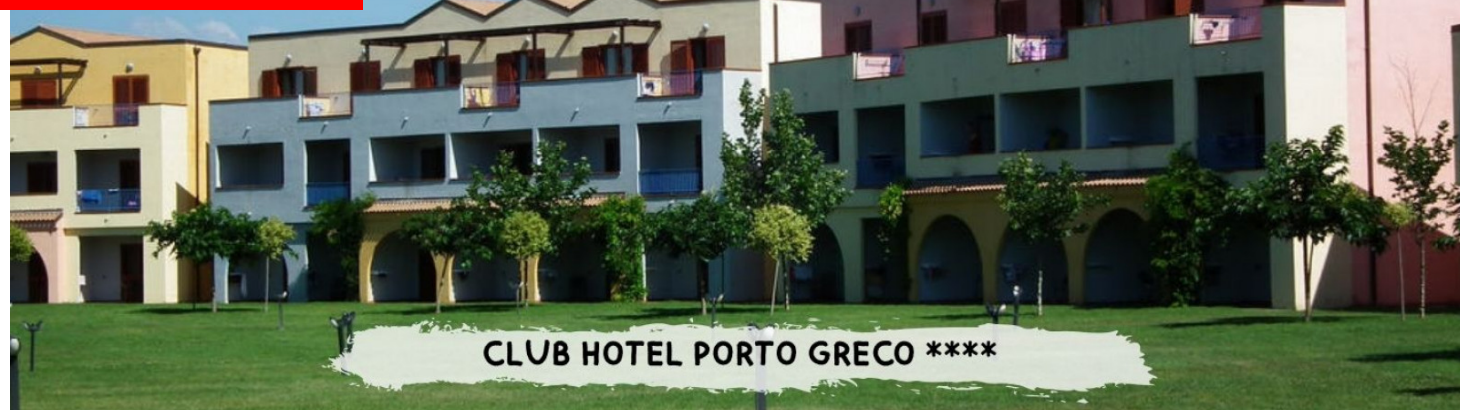
CLUB HOTEL PORTO GRECO ****

quote a persona in pensione completa – bevande incluse in formula "mondotondo club"