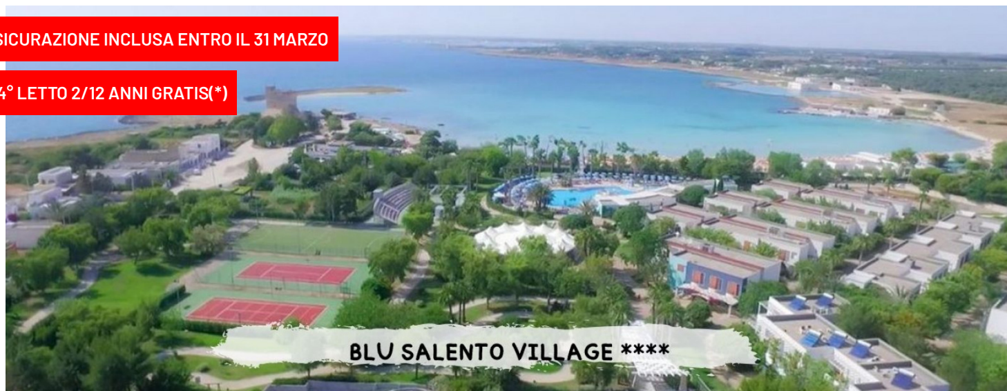
BLU SALENTO VILLAGE ****