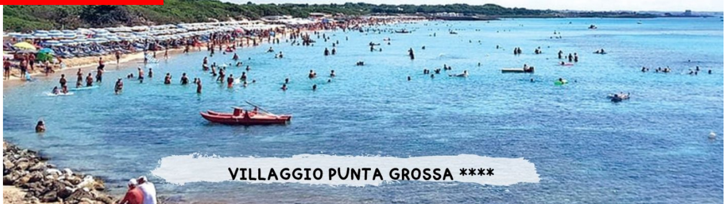
VILLAGGIO PUNTA GROSSA ****

Quote a persona in pensione completa - bevande incluse