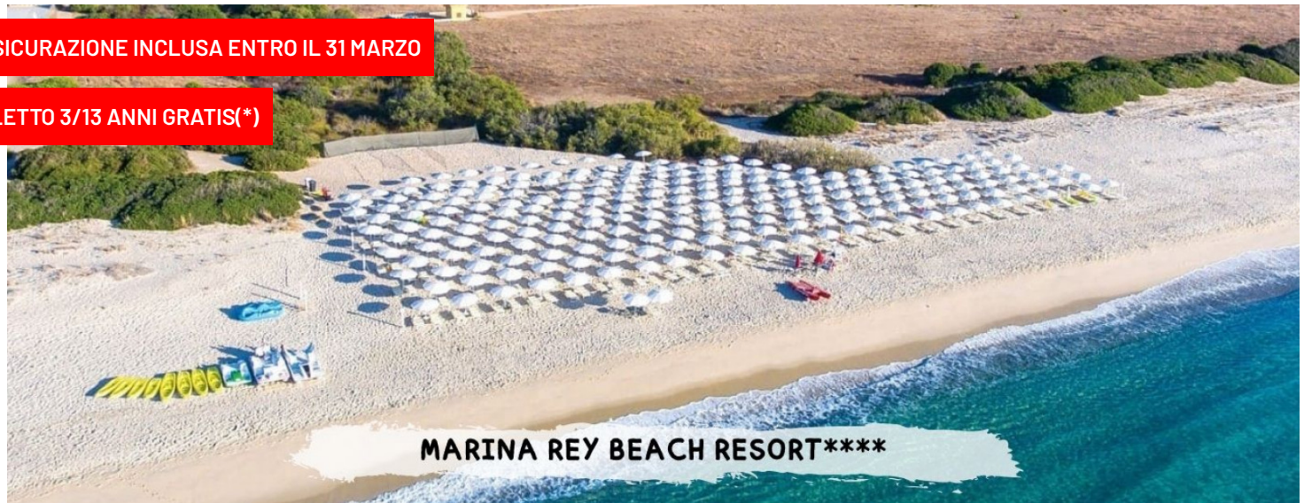
MARINA REY BEACH RESORT****