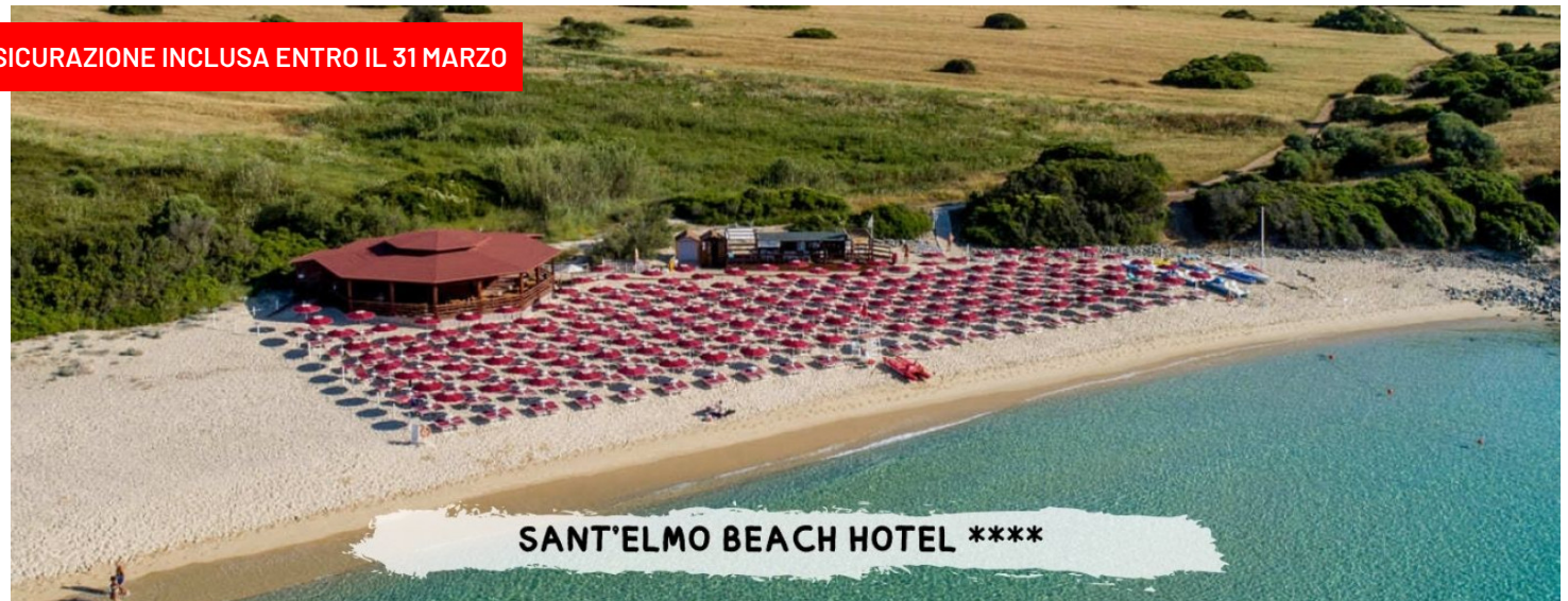
SANT'ELMO BEACH HOTEL ****