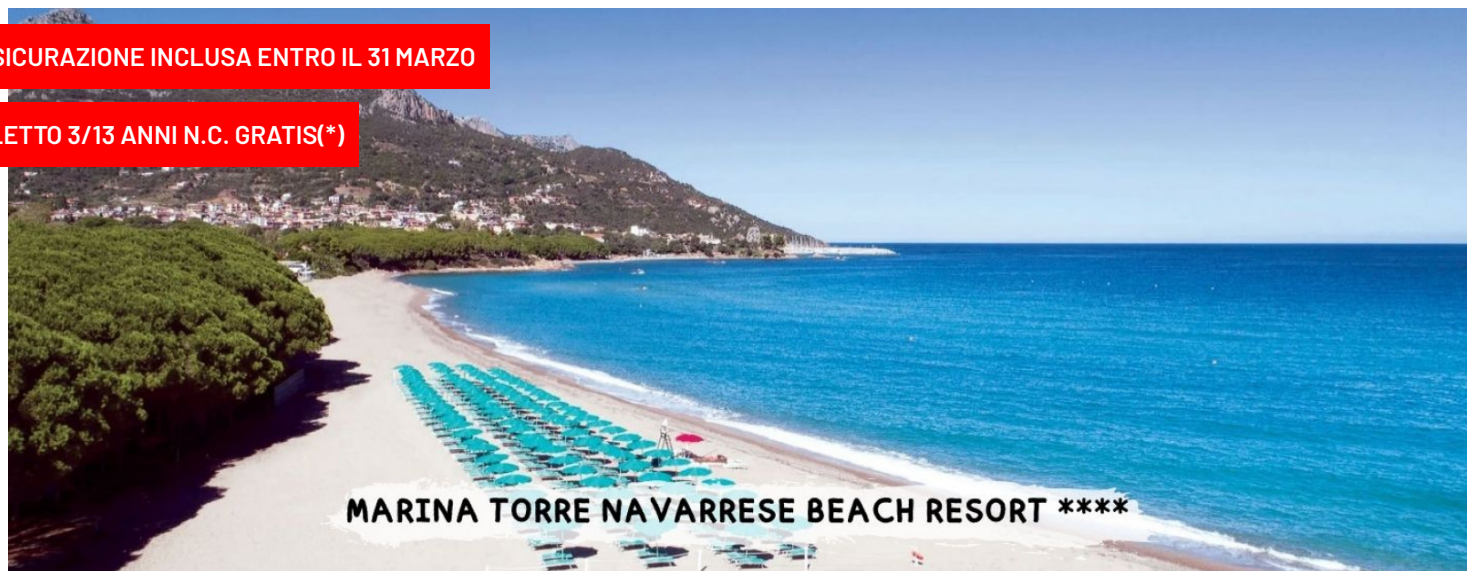
MARINA TORRE NAVARRESE BEACH RESORT ****