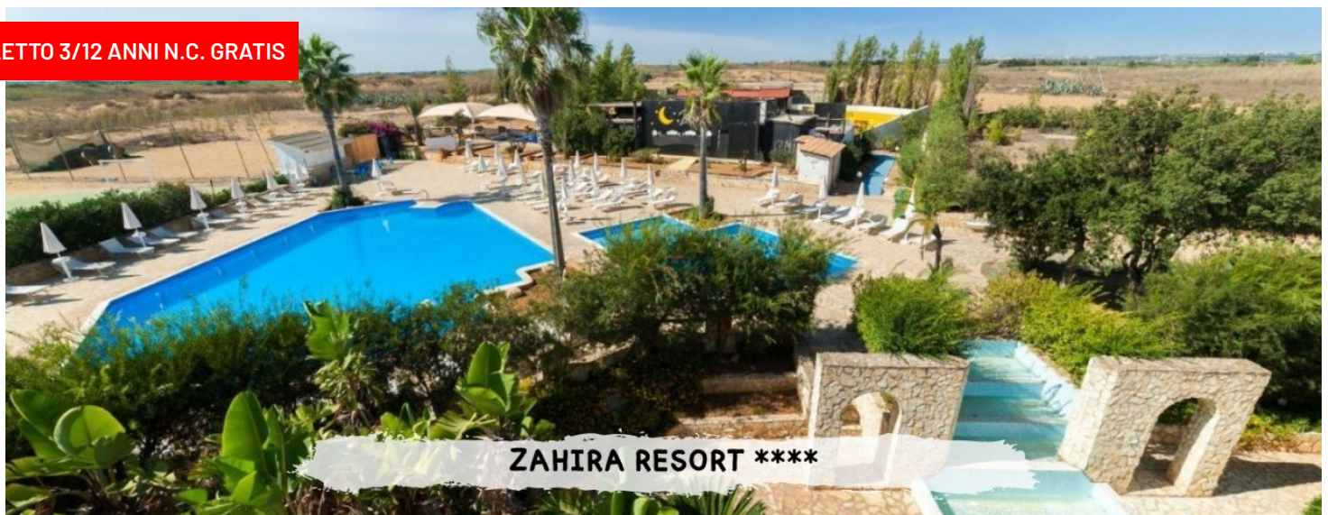
ZAHIRA RESORT ****