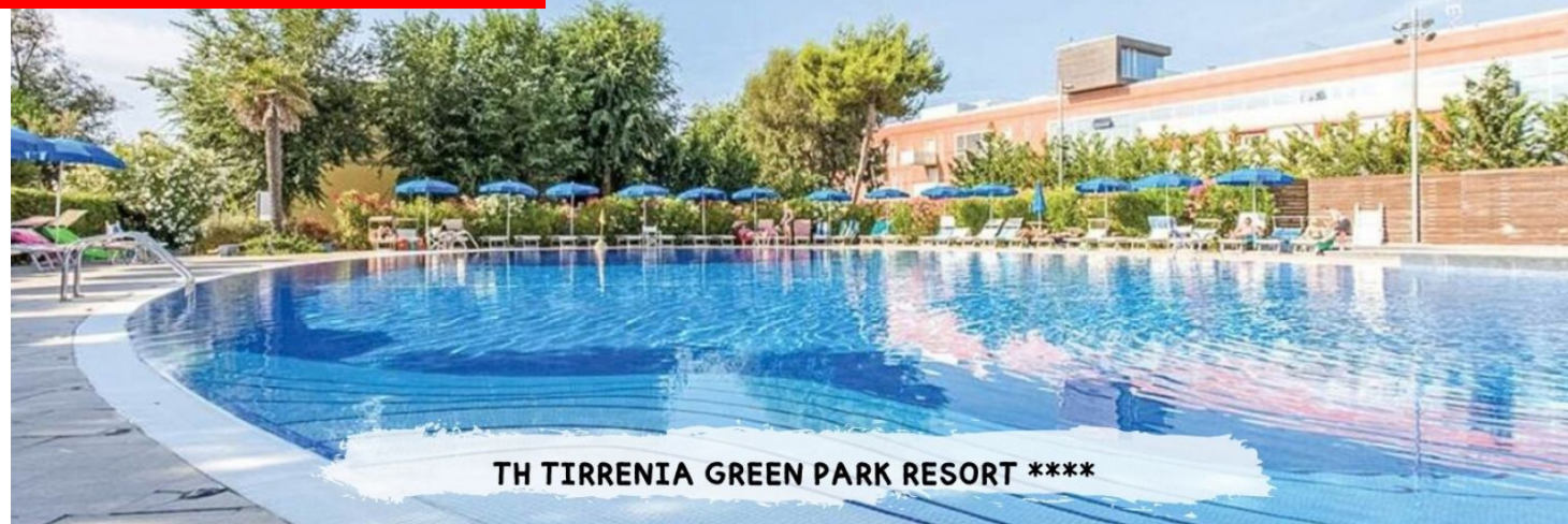
TH TIRRENIA GREEN PARK RESORT ****

PRENOTA PRIMA GARANTITO FINO AL 15 MARZO