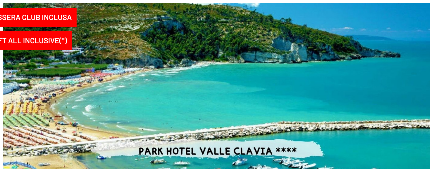
PARK HOTEL VALLE CLAVIA ****

quote a persona a settimana in all soft inclusive(*)