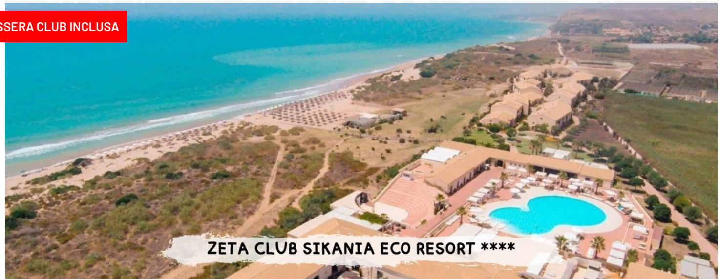
ZETA CLUB SIKANIA ECO RESORT ****